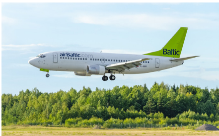
Flug mit Air Baltic