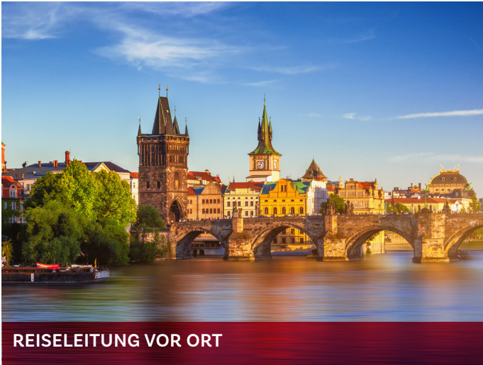
REISELEITUNG VOR ORT

Die Stadt Prag trägt stolz die Spuren ihrer tausendjährigen Geschichte. Von den mittelalterlichen Gassen der Altstadt bis zur majestätischen Prager Burg spiegelt sich die reiche Vergangenheit der Stadt in jedem Stein wieder. Die Prager Burg, eines der größten Schlossareale der Welt, thront majestätisch über der Stadt und bietet einen atemberaubenden Blick auf die Dächer von Prag.