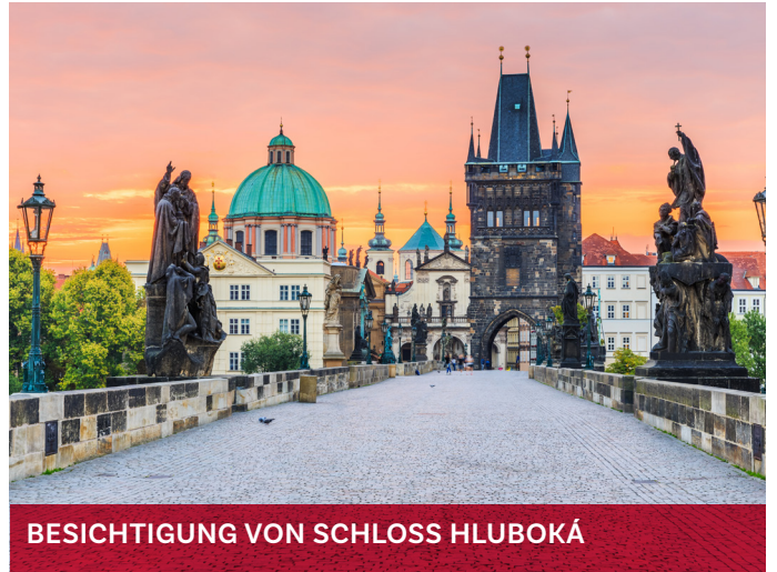
BESICHTIGUNG VON SCHLOSS HLUBOKÁ

Budweis ist eine Stadt in Südböhmen. Das historische Stadtzentrum wurde 1980 in die Liste der städtischen Denkmalreservate in Tschechien aufgenommen. Prag ist seit Jahrhunderten ein Zentrum europäischer Kultur.