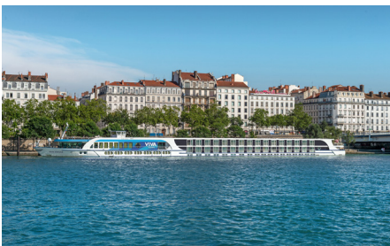
Bustransfer nach Lyon inklusive

Lyon - Tain-l'Hermitage - Arles - Avignon - Viviers - Lyon