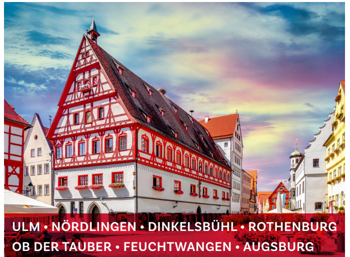
ULM • NÖRDLINGEN • DINKELSBÜHL • ROTHENBURG OB DER TAUBER • FEUCHTWANGEN • AUGSBURG