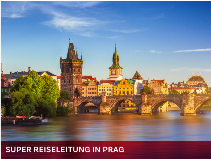
SUPER REISELEITUNG IN PRAG

Weltkulturerbe Unesco, Prag ist seit Jahrhunderten ein Zentrum europäischer Kultur. Aus dieser Stadt kamen berühmte Künstler, Gelehrte und Baumeister, hier waren bedeutende Universitäten angesiedelt. Prag, das oft als hunderttürmige oder goldene Stadt genannt wird, hat aus allen Epochen grossartige Baudenkmäler und Sehenswürdigkeiten bewahrt.